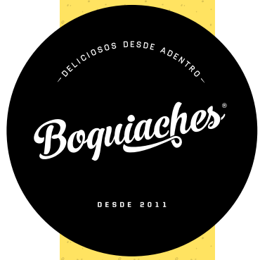
TABLA DE ALÉRGENOS